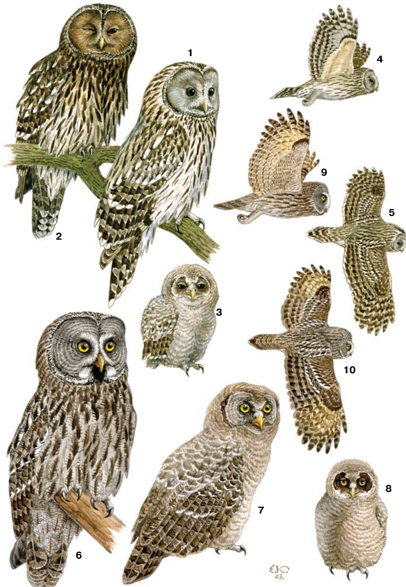
1–5 – длиннохвостая неясыть ( 1 – взрослая птица подвида uralensis ; 2 – взрослая птица темной морфы подвида nasouga ; 3 – птенец в мезоптиле; 4, 5 – птица в полете); 6–10 – бородатая неясыть (6 – взрослая птица; 7 – молодая птица; 8 – птенец в мезоптиле; 9, 10 – птица в полете)

Рисунки Е. Коблика ( из 6 тома сводки «Птицы России и сопредельных регионов» )