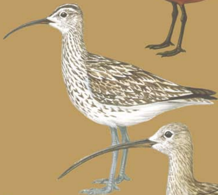
Средний кроншнеп Numenius phaeopus