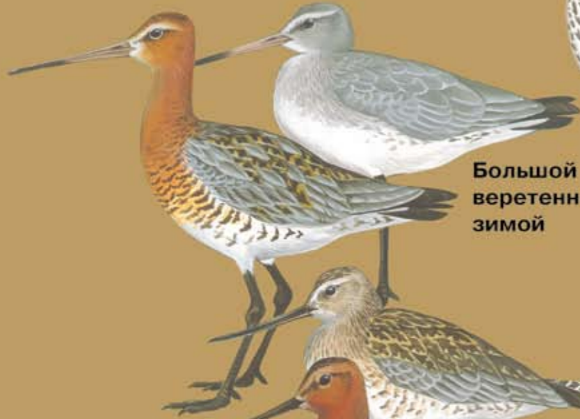
Большой веретенник зимой