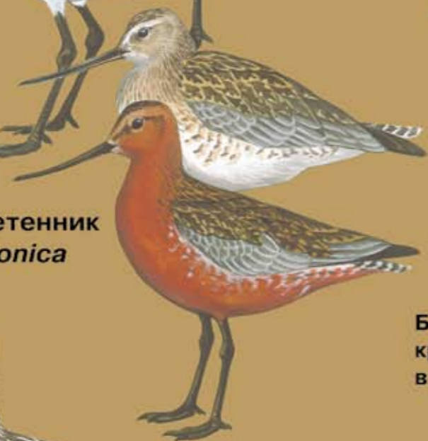
Малый веретенник Limosa lapponica