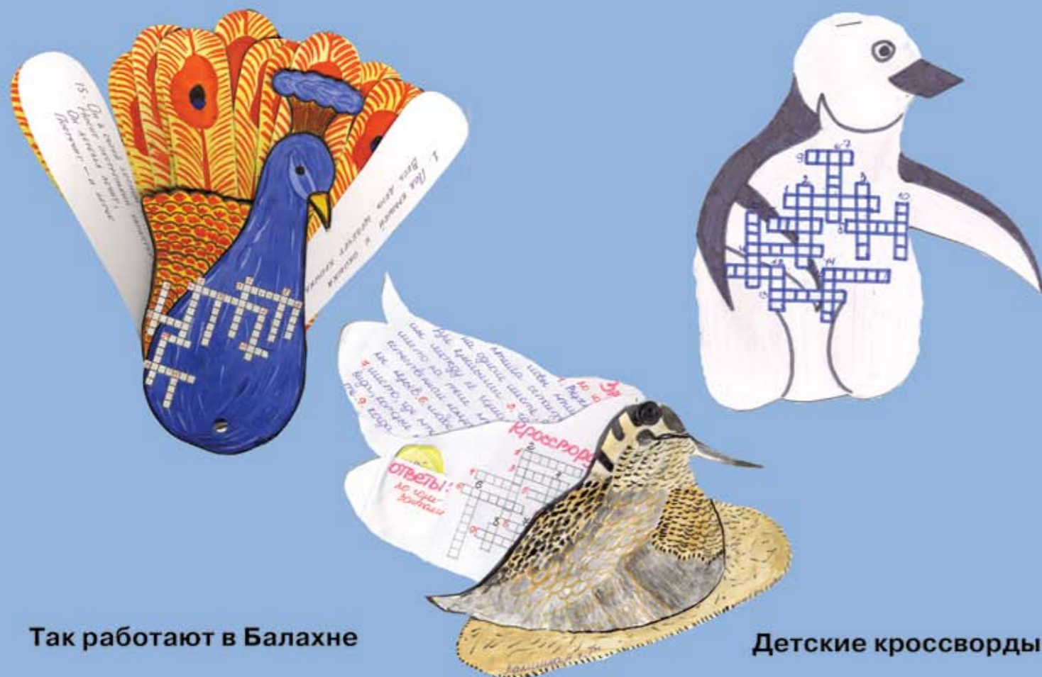
Так работают в Балахне