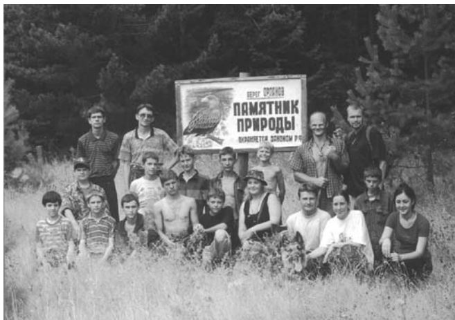
«Слетки» Симбирского отделения Союза. Экспедиция в Старомайский район, 2001 г.

К тому же многим из читателей интересно узнать, как живут в одном из самых депрессивных регионов страны люди, обрекающие себя на непонимание окружающих,