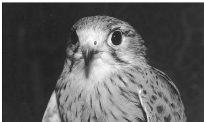
Обыкновенная пустельга – звезда местного ТВ