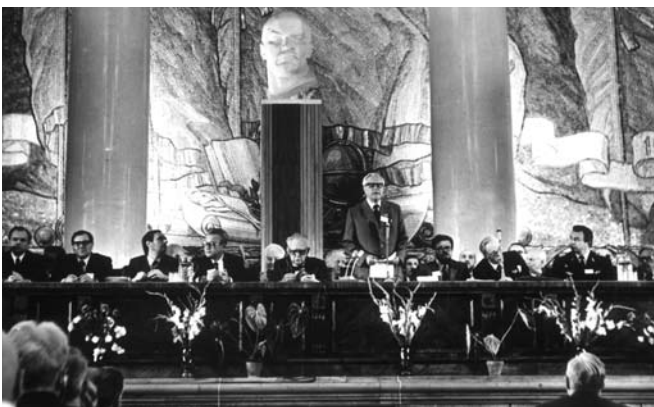
Открытие Конгресса 17 августа 1982 г.

По оценкам участников, XVIII МОК с научной и организационной точек зрения оказался лучшим из всех международных конгрессов, проводившихся в течение предшествующих 25 лет. Это, конечно, высокая оценка труду организаторов, тем более