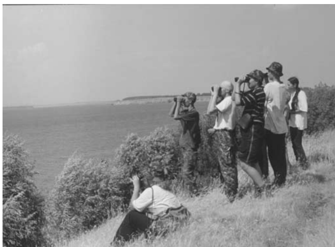
Птицезоры на Волге

Структура бюллетеня следующая. Введение, благодарности (1 страница). Примечания, где расшифрованы сокращения, даны координаты наиболее часто упоминаемых пунктов, приведены описания экспедиций: места,