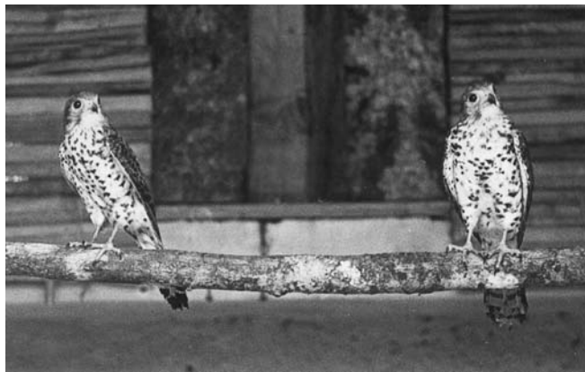
Маврикийская пустельга: слева – самец, справа – самка