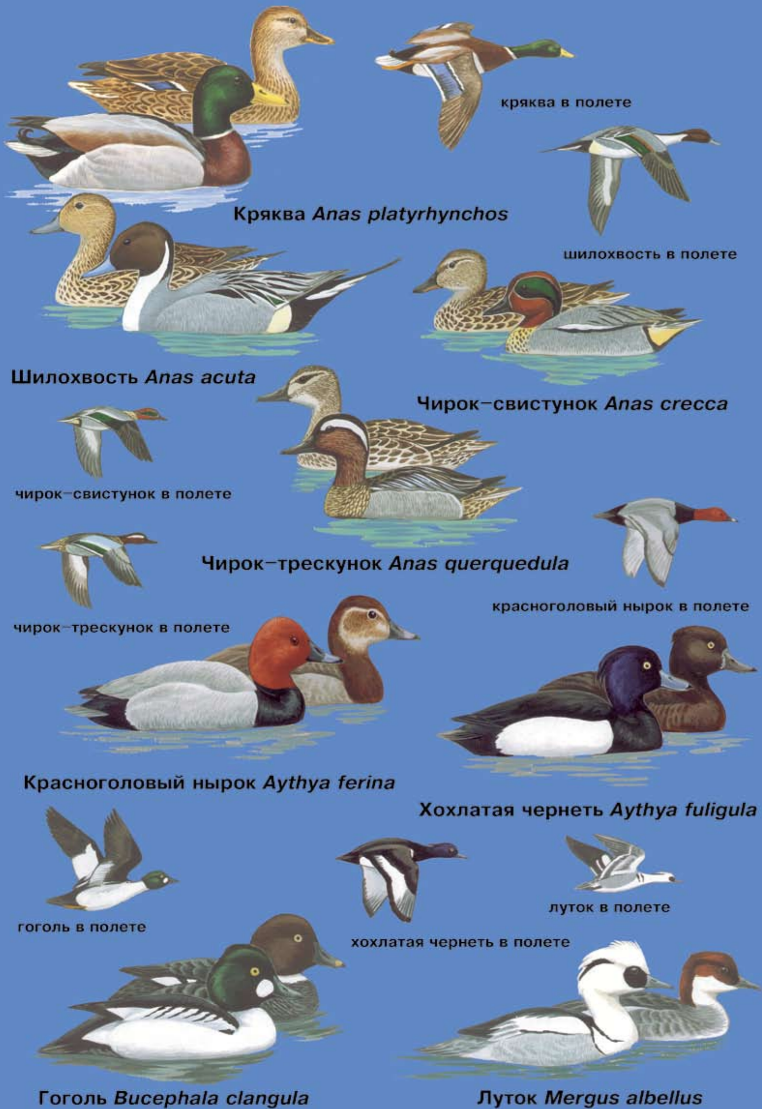
кряква в полете