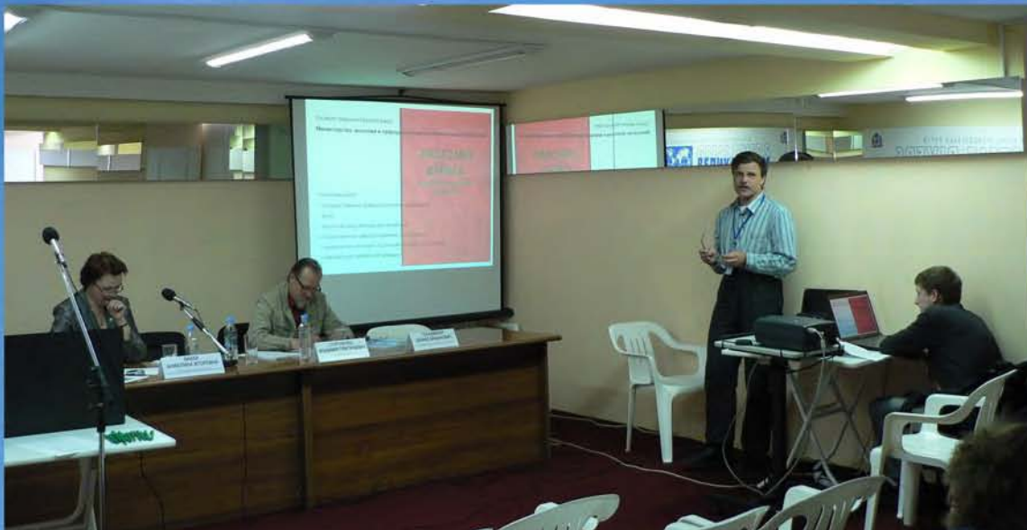
Шесть членов Нижегородского отделения СОПР выступали на круглом столе «Биоразнообразие – важнейший фактор устойчивого развития»