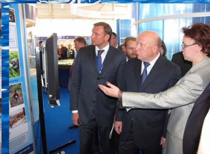
Результаты работы Нижегородского отделения СОПР были представлены также в экспозиции правительства Нижегородской области. Губернатор Нижегородской области В.П. Шанцев знакомится с выставкой