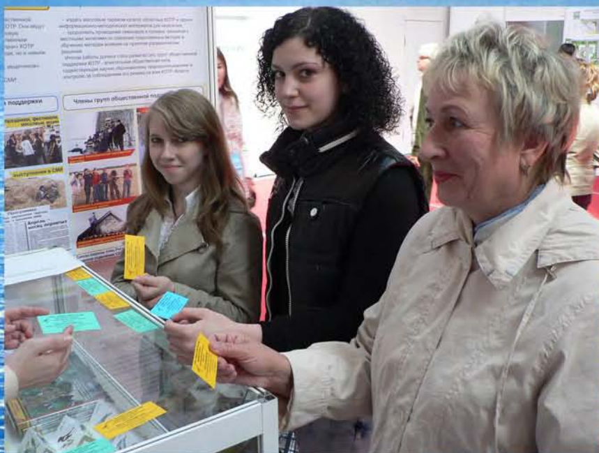
Посетители стенда получали приглашения к участию в проекте «Весна идет!»