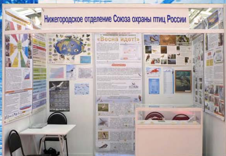
Экспозиция Нижегородского отделения Союза на выставке